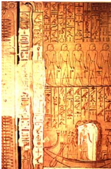
Paroi inachevée de la tombe d'Horemheb

Sans héritier, il nomme son successeur en choisissant un homme mûr, un compagnon d'armes, un militaire nommé Ramsès qui placera rapidement à ses côtés son fils, Séthi , lui aussi appartenant aux rangs de l'armée. Horemheb sans avoir forcément poursuivi les "hérétiques" de la haine implacable dont feront montre les Ramessides, assume pleinement la rupture avec la période qui le précède. S'il semble avoir respecté la dépouille du petit roi, il poursuit Aÿ et Nakhtmin de sa vindicte.