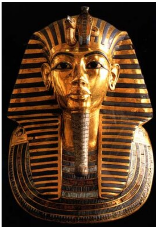
Le masque funéraire de Toutânkhamon

En son nom fut lancée, en l'an 4, une politique de restauration et d'amélioration des structures économiques du pays. La stèle de restauration, du musée du Caire , signale la réfection des idoles et des barques divines, la réorganisation des personnels et des domaines sacerdotaux se situent au premier plan de ses édits. La politique extérieure renoue autant que possible avec le faste du passé : la tombe thébaine du vice-roi de Kouch, Houy, montre le dignitaire recevant les tributs nubiens. Amon , réintégré dans le nom royal et dans l'onomastique, retrouve sa prééminence ; l'organisation traditionnelle des rapports entre les mondes divin et humain redevient la norme.