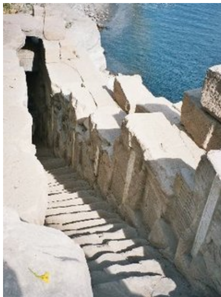
Le Nilomètre d'Elephantine

L'exiguïté du site a contraint les constructeurs successifs à superposer leurs monuments. On retrouve ainsi l'histoire de la ville sous forme stratifié. La cité a été habitée de l'époque préhistorique à la période gréco-romaine au cours de laquelle fut édifié le temple, dont les restes précédée d'une esplanade domine le Nil . On a découvert des chapelles sous le temple lui-même ; certaines, rénovées au Moyen Empire étaient dédiées à Héqaiḥ, nomarque divinisé d'Eléphantine et à sa famille. Le nilomètre servant à mesurer la hauteur de la crue se trouvait au pied du temple. La différence par rapport à la hauteur idéale de 14 coudées permettait de connaître à l'avance l'importance des futures récoltes. D'autres monuments comme le temple périptère érigé par Aménophis III ou le petit temple de Thoutmôsis III ont été détruits. Il n'en reste que les croquis effectués par les premiers égyptologues.