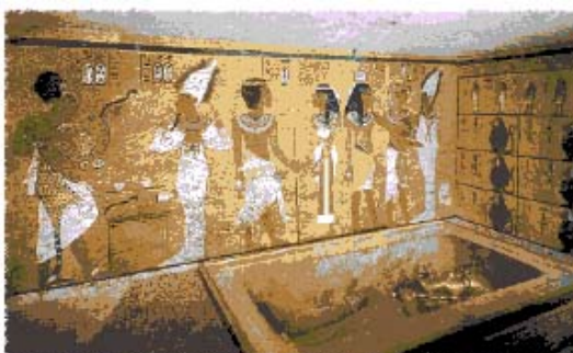
Tombe de Toutankhamon

(celle d' Amenophis III située dans la Vallée de l'Ouest) est le prototype de toutes les grandes tombes royales réalisées par la suite. On peut voir notamment aujourd'hui, celles d' Horemheb , Séthi I , Ramsès VI, Ramsès III, Ramsès IX (celle de Ramsès II très abîmée n'est pas visitable). Dans ces grands hypogées royaux dont la longueur dépasse une centaine de mètres, la décoration des parois sculptée et peinte est très soignée. La salle du sarcophage comporte un plafond taillé parfois en forme de voûte et comporte des représentations dites "astronomiques" : évocation des constellations, des étoiles, des divinités du ciel. Dans celle de Ramsès VI est représentée la déesse du ciel, Nout. Symboliquement, le défunt, tel le soleil figuré sous la forme d'un disque, parcourait le corps de Nout pour renaître chaque matin. Aucune de ces représentations n'était destinée à être vue, une fois la tombe refermée, après l'accomplissement des cérémonies accompagnant l'inhumation du roi qui étaient assurées par son successeur.