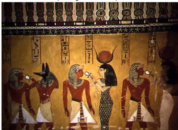
Tombe de Thoutmôsis IV

La petitesse de certaines tombes est due à la brièveté du règne. Cependant, malgré ses faibles dimensions, celle de Thoutânkhamon est exceptionnelle. Découverte en 1922, elle révèle la richesse extraordinaire du mobilier funéraire qui accompagnait un souverain dans l'au-delà. Le roi était entouré de tout les objets qui lui étaient utiles de son vivant : lits, sièges, chars, vases. Il disposait même d'aliments et de nombreux ouchebtis étaient à son service. Deux gardiens se trouvaient à l'entrée de la chambre funéraire où reposait la momie placée à l'intérieur de plusieurs cercueils et coffres emboîtés les uns dans les autres et entièrement plaqués d'or. Substance lumineuse et impérissable, l'or était la chair divine. La richesse du mobilier de Thoutankhamon laisse deviner quelle devait être l'ampleur des trésors qui furent dérobés dans les plus grandes sépultures.