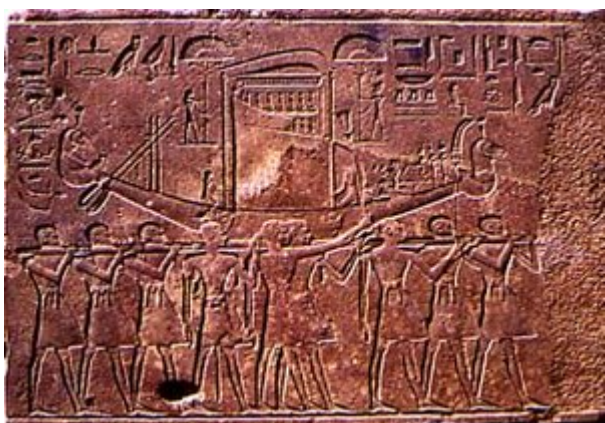
La barque sacrée du dieu Amon mené vers le quai embarcadère lors de la "Belle fête de la vallée". Bloc de la chapelle rouge

Les premiers souverains de la dynastie, prenant la tête d'un pays appauvri, se sont particulièrement attachés à restaurer les sanctuaires des Thébains et de leurs alliés. Hatchepsout profite de l'abondance récente que les conquêtes asiatiques ont apporté au pays pour poursuivre cette Oeuvre de restauration et s'intéresser à des fondations jusqu'alors totalement délaissées. Forte de cette tradition qu'elle détourne à son profit, elle se montre comme un des souverains ayant participé à la reconquête effective du pays. Le texte de restauration du Spéos Artémidos la présente comme celle qui a bouté les Hyksôs hors d'égypte.