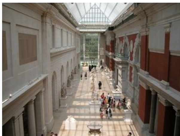
Carroll and Milton Petrie European Sculpture Court

Une collection encyclopédique d'instruments de musique du monde entier peut aussi être admirée ainsi qu'une série d'intérieurs, comme une chambre romaine du premier siècle avant Jésus-Christ ou une pièce dessinée par l'architecte américain Frank Lloyd Wright. Il faut également mentionner sa collection d'armes et d'armures antiques d'Europe, mais aussi du Japon, des États-Unis et du Moyen-Orient