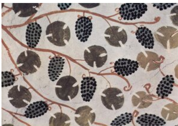
Détail de la décoration de la tombe

Elle a toujours fasciné les visiteurs pour son plafond, qui reproduit le réalisme des couleurs éclatantes avec une grande pergola, d'où son surnom.