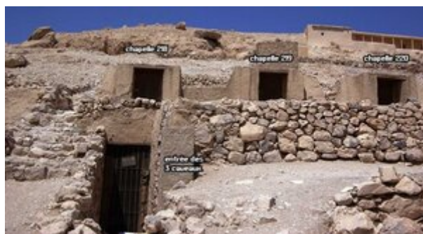
Vue de l'entrée

C'est la sépulture de Nebenmaât, artisan du village de Deir el-Médineh durant l'époque ramesside ; elle est intégrée dans un complexe funéraire familial où Amennakht, son fils Nebenmaât et son petit-fils Khaemter disposent de trois caveaux bénéficiant de parties communes et de trois chapelles de surface contiguës (Tombes thébaines 218, 219 et 220). Elle fut découverte en 1928 par l'égyptologue français Bernard Bruyère (1879-1971). Les peintures murales du caveau se rattachent au style monochrome où domine la couleur dorée.