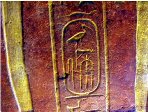
Cartouche de Thoutmôsis IV sur son sarcophage

Quoi qu'il en soit dans l'antichambre de cette tombe on trouve une inscription hiéroglyphique qui relate une inspection de la tombe en l'an 8 d' Horemheb , par le directeur du trésor Maya. Il indique qu'il procéda à la « restauration » de la tombe ce qui confirmerait l'hypothèse d'une dégradation volontaire.