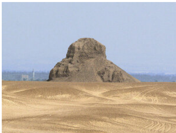
La pyramide ruinée d'Amenemhat III ou pyramide noire

Le complexe, fortement ruiné, est dominé par le massif de briques, ancien noyau de la pyramide autrefois revêtu d'un parement de calcaire fin de Tourah. Composé d'une chaussée, d'un temple funéraire et d'un temple de la vallée, le plan est orienté classiquement suivant l'axe est-ouest contrairement au complexe construit par le père d' Amenemhat III , Sésostris III .