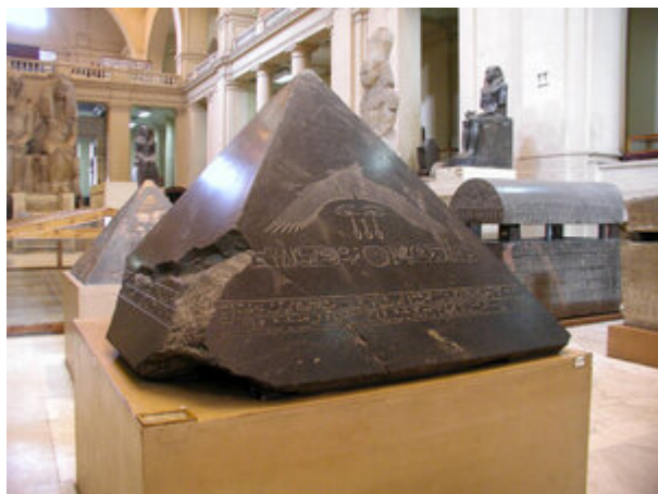
Pyramidion en granite exposé au Musée du Caire

pièces de joaillerie. Dieter Arnold pense que le complexe funéraire d'Aat fut planifié dès le début de la construction de la pyramide puis, que les plans furent modifiés peu avant la fin de la construction afin d'y inclure la tombe d'une autre reine avec un agencement semblable et placé à côté du premier tombeau. Là aussi, des objets furent découverts tels des bijoux et des fragments de statues. Des débris d'ossements appartenant aux deux reines ont pu être étudiés. Les résultats des analyses ont permis d'estimer leur âge : Aat devait avoir environ trente-cinq ans et la seconde reine environ vingt-cinq ans.