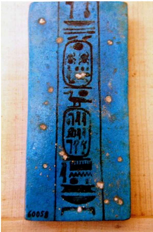
Cartouche donnant le nom complet du pharaon Aï.

Alexandre Barsanti (1858-1917) avait repéré au mois de décembre 1891 des tombes creusées au flanc du piton rocheux de Darb el-Hamzaouï, qui s'avérèrent être celles de hauts dignitaires de la cour d'Akhenaton à Akhetaton. Des sept sépultures qu'il fouille, une seule était détériorée. Bouriant