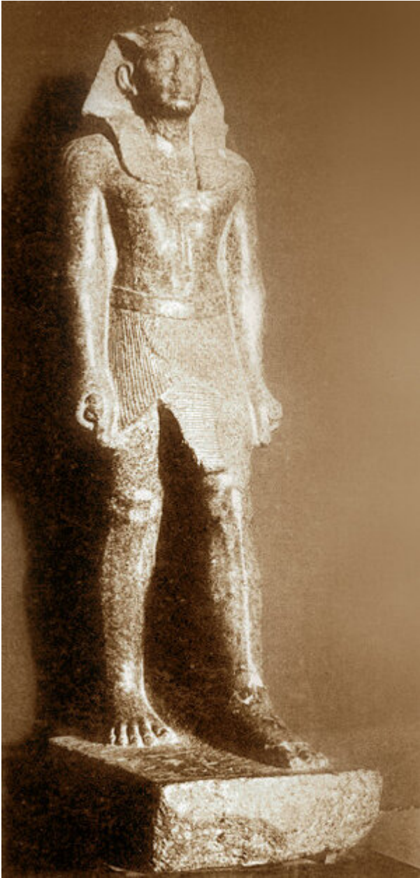
Statue de Sekhemrê-Ouadjkhâou Sobekemsaf provenant d'Abydos, aujourd'hui au Musée égyptien du Caire.

après ceux des trois Antef (qu'il classe comme suit : Sekhemrê-Oupmaât Antef-Âa VI, Noubkheperrê Antef VII et Sekhemrê-Herouhermaât Antef VIII). Il a d'abord remarqué qu'un fils du roi Antefmes est loué par un roi Sobekemsaf pour son rôle lors d'une fête de Sokar sur la statuette au British Museum (enregistrement no EA 13329). Selon Ryholt, ce nom d'Antefmes est basilophore et donc le roi Sobekemsaf qui l'a loué doit avoir été un successeur du roi Antef auquel le nom Antefmes fait référence. De plus, comme le fils et présumé successeur de Sekhemrê-Ouadjkhâou Sobekemsaf s'appelait également Sobekemsaf plutôt qu'Antef, Ryholt en a conclu que ce roi devait avoir régné après les rois Antef.