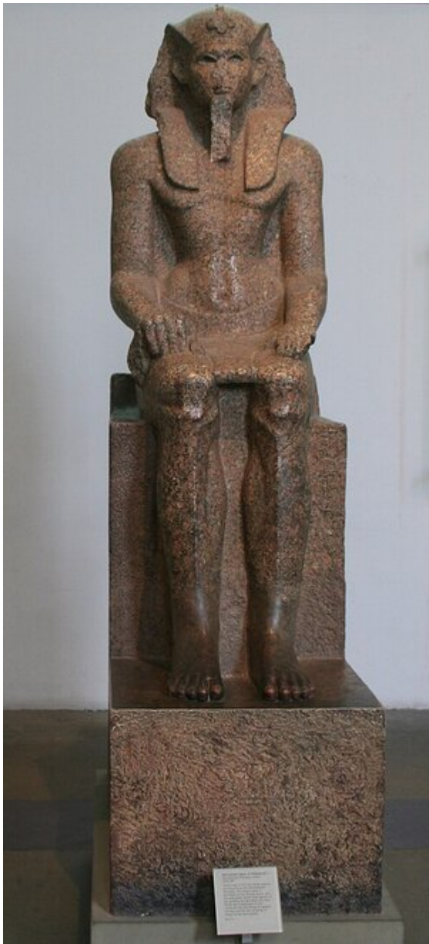
Statue en granit rouge du roi Sekhemrê-Ouadjkhâou Sobekemsaf, British Museum.