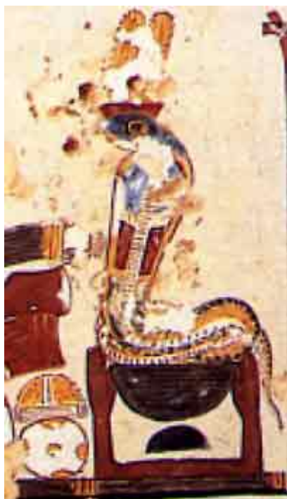
La déesse cobra Rénénounet

Rénénoutet, la dame des moissons, déesse cobra vénéré à Medinet-Mâdi qui veillait sur la fertilité du sol et sur les moissons. C’était une sorte de génie familier.