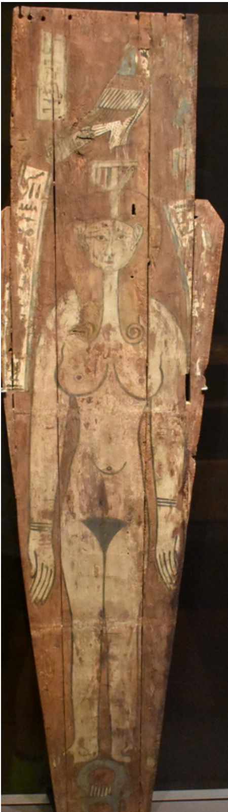
Musée archéologique de Madrid n° inventaire 2002/70/1

Sur un fragment de cercueil correspondant à l'intérieur de la base du sarcophage de la momie, on peut voir une représentation de la déesse Imentèt, en allusion claire à la nécropole et au lieu où les défunts avaient leur demeure dans l'éternité.