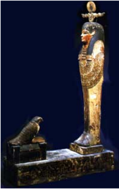
Figure de Ptah-Sokar-Osiris

Le nom du dieu était en fait essentiellement associé dans les textes à la célébration de fêtes funéraires. Son culte, centré sur la région memphite sous l' Ancien Empire , se propage sous le Moyen Empire , pour s'implanter finalement à Thèbes au Nouvel Empire . C'est là que l'on trouve les plus nombreux témoignages de célébrations accomplies en son nom. Sa fête annuelle, nommée simplement « fête de Sokar », avait lieu au environ du vingt-cinquième jour du quatrième mois de la saison akhet (l'inondation) et fut intégrée aux fêtes d' Osiris . C'était évidemment un moment privilégié de commémoration des morts. Sokar fut d'ailleurs très tôt associé au culte d' Osiris dans le grand sanctuaire d' Abydos .