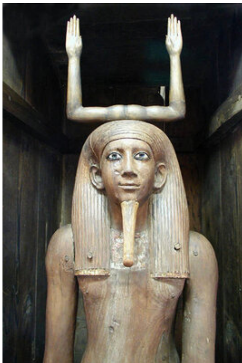
Statue du ka du pharaon Aoutibrê Hor, Musée égyptien du Caire

Durant son règne il rénove la pyramide d' Amenemhat III .